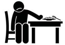
Pérdida de apetito