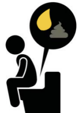
Orina oscura, heces pálidas y diarrea

Si cree que tiene hepatitis A porque presenta estos síntomas, acuda a su doctor o visite la sala de emergencias más cercana. Siempre lávese las manos con agua y jabón después de usar el baño y antes de preparar los