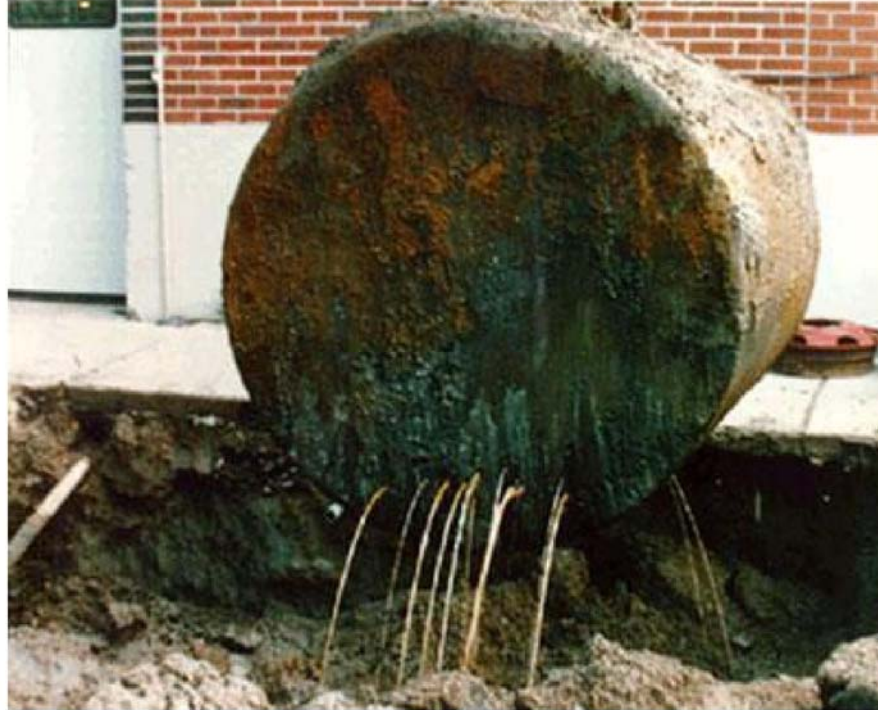
بدون الحماية المناسبة من التآكل، قد يتسرب المنتج.