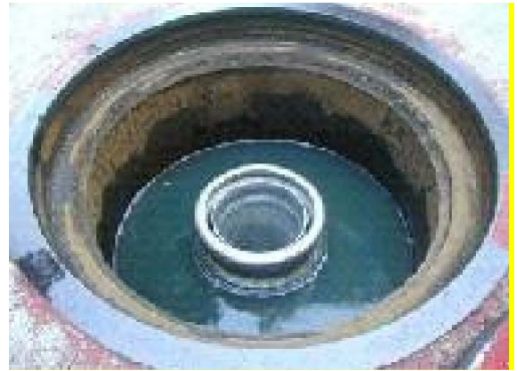
له مهیتت خالی بکه که تلی رژانه سه پیویسته ناگادار به تکایه پاشماوه/ناو/نی مه سوته