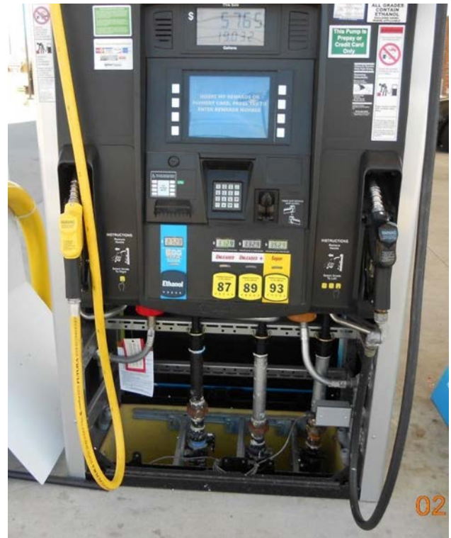
له مهیتت خالی بکه که مفری رژانه ده پیویسته ناگادار به تکایه پاشماوه/ناو/نی مه سوته

سه شی کشتوکال، دهش به وانه کانی تر، له، نازانسه ناگادار به تکایه وای ناوخویی و نیشتمانی داواکاری یاسایی لاتدارانی پیسبوونی هه ر پیویستیت به گه نه یهکان هه ره کار پیکردنی دیسپینسه ت به تاییه له هاوکاری کاری بچوک بکندی به یوه په، تکایه یه تی هه یارمه 1-800-532-8013 یان (615) 734-3619 فونی له تهی ژماره ریگه